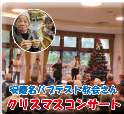
かわいいプレゼントも頂きました☆