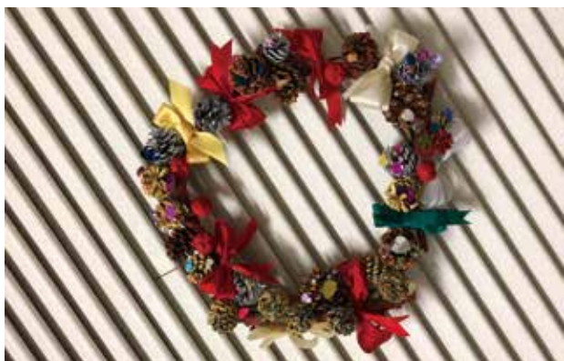
完成したクリスマスリース

今回私が教わったことは、人は誰かに称賛されたり、喜んでもらえた時に初めて、自分の存在や価値を感じられるということです。