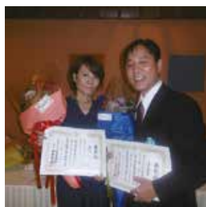
沖縄県医師会主催 永年勤続医療従事者表彰授与式