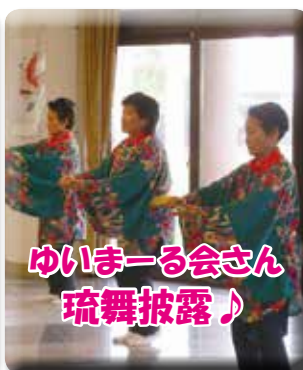
華麗な舞いを披露してくれました!