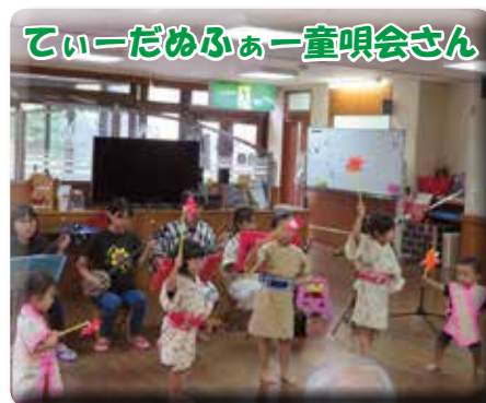
かわいい園児達に癒されます☆