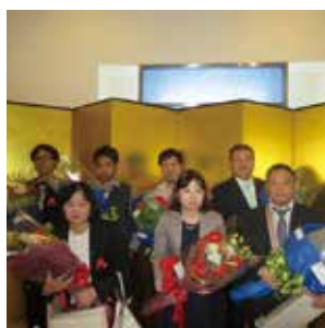
中部地区医師会主催 永年勤続医療従事者表彰授与式