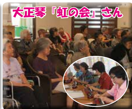
素敵な琴の音色に酔いしました♪