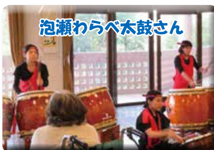
迫力の和太鼓による演武!!