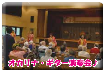
オカリナの音色にうっとり気分♪