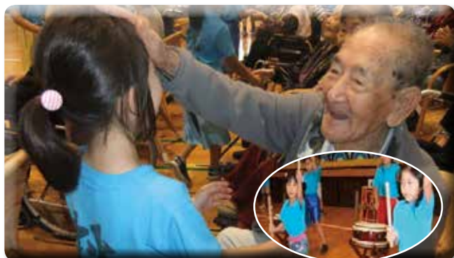
ひまわり学童クラブのみなさんとの交流会♪地域子ども達とのふれあいは元気の源になっています。