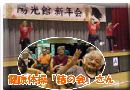
健康体操でちゃーがんじゅー★

陽光館では、昨年1年間多くのボランティアの方々による様々な余興がとり行われました。ボランティアの方々のご協力を得て、療養者の皆様は充実した生活を送ることが出来ます。本当にありがとうございます。これからも、多くの方々のご協力の下、より良い施設サービスを行ってまいります。今年も、多数のボランティアによるイベントを予定していますので、どうぞご期待ください。