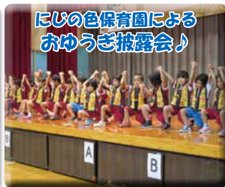
かわいい園児達に癒されます☆